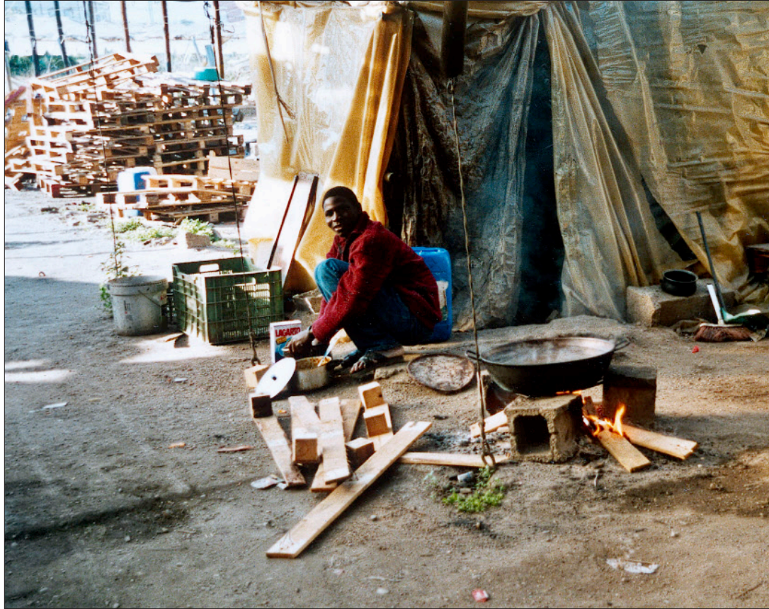
In solch ärmlichen Verhältnissen hausen die illegalen Immigranten, die vorwiegend aus Nordafrika stammen, aber auch aus Osteuropa und Südamerika.

Zuerst einmal, was die Arbeitsverhältnisse in den Gewächshäusern betrifft. Man hätte annehmen dürfen, dass nach acht Jahren eine Besserung eingetreten wäre, und sei es auch nur die kleinste. Aber davon ist nichts wahrzunehmen. Im Gegenteil, Tatsache ist, dass der grösste Teil der Arbeitskräfte aus illegalen Immigranten be-