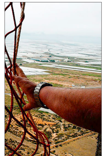
Gefangen in El Ejido.

Noch ein Wort zur Nahrungssicherheit. Vor einiger Zeit haben deutsche Labordienste im Gemüse aus El Ejido Rückstände verbotener Pestizide gefunden, was an Ort und Stelle der Herkunft verständlicherweise zu einem grossen Wirbel geführt hat. Dann kamen auch aus Grossbritannien, Finnland und Ungarn ähnliche Nachrichten. Nun wird plötzlich umgedacht. Bereits haben 200 Produzenten mit 700 Hektaren Gewächshäuser auf Bio umgestellt. Aber die Zeit drängt, und der Handel beginnt zu leiden. Wäre es der Anfang des Endes des sogenannten «Wunders von El Ejido»?