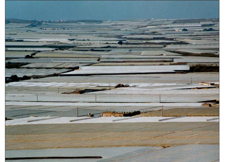
Das weisse Plastikmeer von El Ejido in Südspanien.

Gibt es einen noch grösseren Unsinn? Das Wasser wurde bis jetzt aus dem Grundwasserreservoir gepumpt. Nun ist aber auch das niedrigste davon – in 1500 Meter Tiefe gelegen – erschöpft. Die Konsequenz daraus: Man muss nun Meerwasser entsalzen. Das ist allerdings ein kostspieliges Unternehmen und verteuert eine Produktion, die auch Unmengen von Abfällen aller Art generiert. Die Spezialisten schätzen das Volumen auf 3 Millionen Tonnen, das