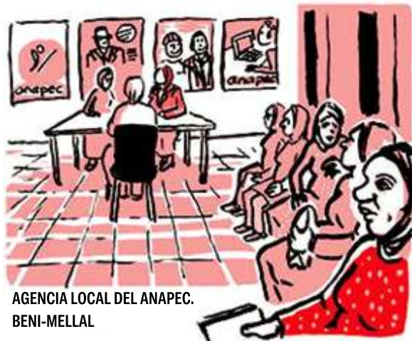
AGENCIA LOCAL DEL ANAPEC. BENI-MELLAL